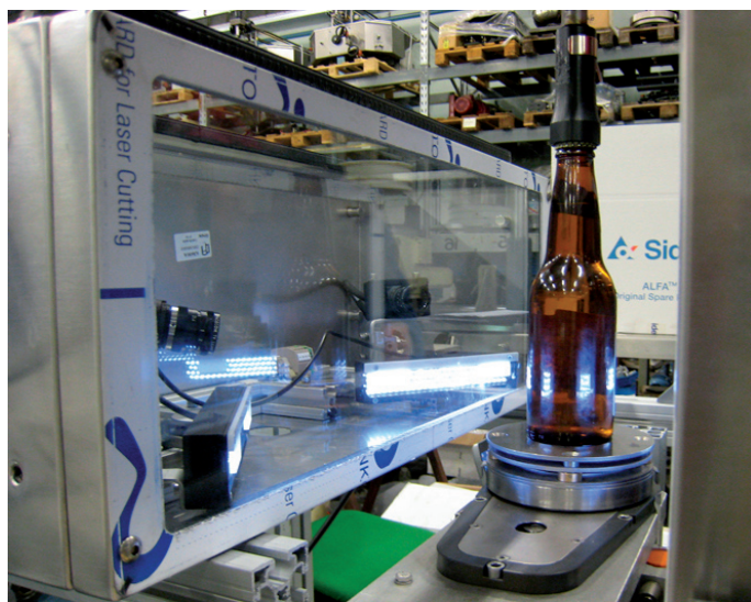
Costituito da quattro telecamere ad alta risoluzione, il sistema Accu-track4 è in grado di misurare con precisione millimetrica l'angolo di rotazione delle bottiglie che entrano nel suo raggio di azione.